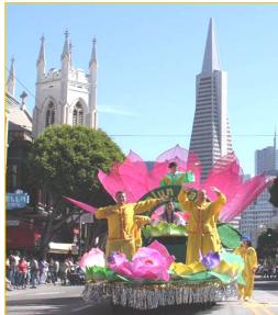
花车上演示法轮功功法

法轮功队伍以天国乐团打头阵，演奏了“法轮大法好”等乐曲，随后是花车、炼功队及明慧学校小弟子表演的剑舞。沿途观众有的跟着乐团吹奏的乐曲，和着拍子而舞动，有的欢呼鼓掌，有的在学法轮功学员的炼功动作。游行组委说：“旧金山的每个游行活动，都应邀请法轮功参加，法轮功是不可缺少的团体。”