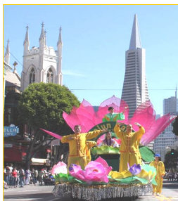
花车上演示法轮功功法

法轮功队伍以天国乐团打头阵，演奏了“法轮大法好”等乐曲，随后是花车、炼功队及明慧学校小弟子表演的剑舞。沿途观众有的跟着乐团吹奏的乐曲，和着拍子而舞动，有的欢呼鼓掌，有的在学法轮功学员的炼功动作。游行组委说：“旧金山的每个游行活动，都应邀请法轮功参加，法轮功是不可缺少的团体。”