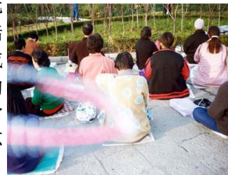
能量场——法轮功学员炼功时拍到的奇妙景象

就拿我的身体变化来说吧，我没吃任何药，就靠修炼法轮功病就好了。不光我这样，我认识的中国大陆许多法轮功学员中，甚至成千上万的人都重复了我的经历，这不就是真实而超常的“群体现象”吗？这不正是人类最值得进一步去探索的超常的科学吗？