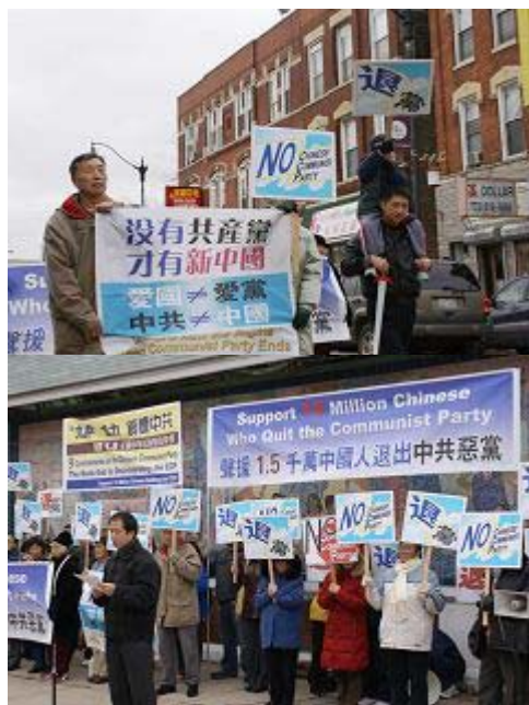
芝加哥南华埠广场上的集会活动

很多中国城的华人索要数份真相资料，更多的人们站在店门口、窗户后观看游行。一些华人微笑着向参加游行的人们或招手致意，或合十。观看的西方民众更是连连鼓掌欢迎，有的还自愿的加入到游行队伍中来。