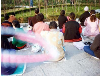
能量场——法轮功学员炼功时拍到的奇妙景象

法轮功在人的精神境界方面带给修炼者的变化也很大。当时我身边的朋友、学生、同事都发现我的世