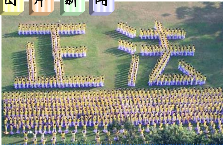
二零零六年香港法轮大法修炼心得交流会，于十一月十一日在九龙太子明爱服务中心成功召开。图为交流会期间，逾千学员在公园集体炼功，组成“正法”两字。