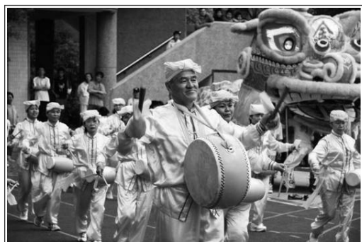
二零零六年十一月十二日在台湾桃园县芦竹乡山脚国中举办每两年一次的“全乡暨长青运动大会”，来自芦竹乡各村、社区及公所等五十三个团体参加，与会者从乡长、议员、乡民代表到乡民、学生等达四千多人，可谓当地一大盛事。法轮功学员受邀在运动会中表演功法及腰鼓。上图是法轮功腰鼓队员精神奕奕，鼓声震天。

生活中，生命中，真正的宝不是钱财，是真正能够给你带来幸福、福分的东西。请朋友珍惜机缘，也常念诵“法轮大法好，真、善、忍好”，定有福报。◇