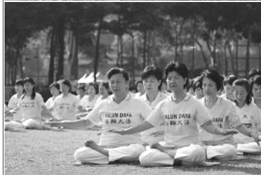
二零零六年香港法轮大法修炼心得交流会，十一月十一日在九龙太子明爱服务中心礼堂成功召开。上图为交流会期间，逾千学员在维多利亚公园集体炼功，组成“正法”两个字，下图为交流会期间学员集体炼功。