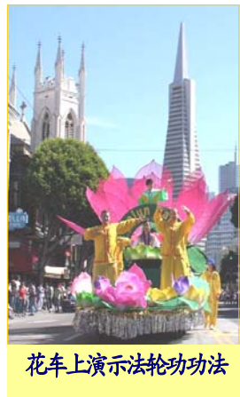
花车上演示法轮功功法

法轮大法已洪传世界八十多个国家，受到各国各地区人民的尊敬和爱戴，迄今为止所获褒奖、支持议案等已超过二千七百一十六项。