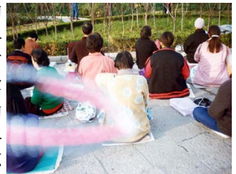
能量场——法轮功学员炼功时拍到的奇妙景象

高大维：我们现在说的科学，主要是指西方实证科学。东方的修炼文化，还有宗教的神奇事迹，都不在实证科学的范围内，但人类的科学也是要发展的，现在科学还没触及到的东西，并不一定就不是科学。目前人类的知识很有限，我们不能被僵化了的观念约束了自己。