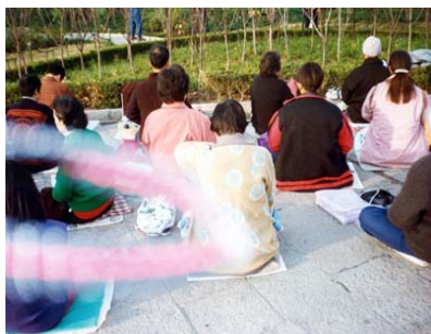
能量场——法轮功学员炼功时拍到的奇妙景象

就拿我的身体变化来说吧，我没吃任何药，靠修炼法轮功病就好了。不光我这样，我认识的中国大陆许多法轮功学员中，甚至成千上万的人都重复了我的经历，这不就是真实而超常的“群体现象”吗？这不正是人类最值得进一步去探索的超常的科学吗？