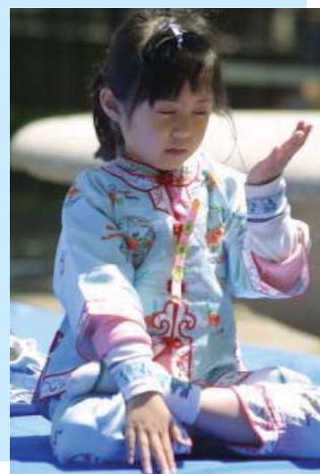
图片赏析——纯 图片：美国德州拉伯克爱弗兰斯报 五套功法！神通加持法

爱因斯坦对这个问题的态度很明确，他说：“我相信个人应当根据他的良心行事，……”他还说：“我想做的事，不过是要以我微弱的能力来为真理和正义服务，准备为此甘冒不为任何人欢迎的危险。”◇