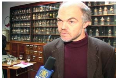
万可润可斯文参议员就制止中共器官贩卖接受记者采访

官有可能是从死刑犯身上摘取所得，并高额出售。但这并不能解释所有的器官来源。万可润可斯文先生说：“如果你把在中国的器官移植数量和官方报道的死刑数量作比较，你就会发现还有大约六千例的差距。”