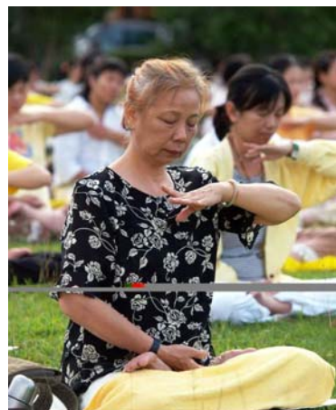
▲晨炼中的台湾法轮功学员

法轮大法好，是真的。赞叹师尊之伟大、佛法之精深玄奥。今生何其有幸能得法，想不到因祸而得福。人生命的意义、生活的目的地为何？我终于在《转法轮》中找到答案。我学法炼功已八个月，天天幸福洋溢、快乐满足。感恩师尊的慈悲救度，颇有相见恨晚之憾。朋友们别迟疑！快加入修炼的行列吧！◇