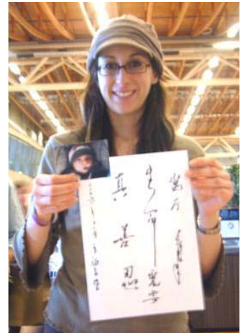
▲一位妈妈高兴的举着孩子照片和“真善忍”条幅

二零零六年十一月瑞士弗里堡健康博览会上法轮功展位受到欢迎。当了解了法轮功洪传世界八十多个国家的盛况和“真善忍”中文字的意义后，参观者纷纷索要“真善忍好”，“生命需要真善忍”等条幅。有几位推儿童车的妈妈，拿到条幅后，她们高兴的说，要回家镶在镜框里，挂在墙上，她们希望孩子能按“真善忍”的做人准则来成长。◇