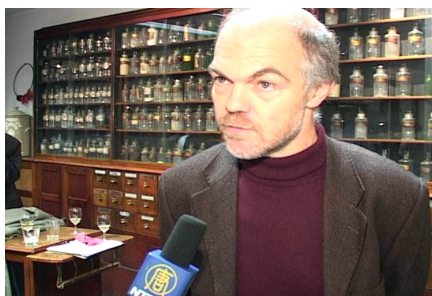
万可润可斯文参议员就制止中共器官贩卖接受记者采访

并高额出售。但这并不能解释所有的器官来源。万可润可斯文先生说：“如果你把在中国的器官移植数量和官方报道的死刑数量作比较，你就会发现还有大约六千例的差距。”