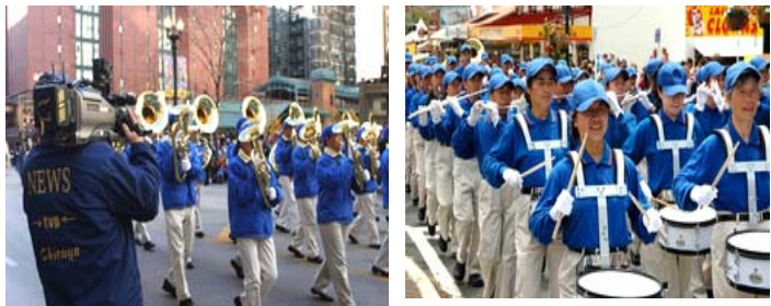
芝加哥感恩节游行 天国乐团放异彩