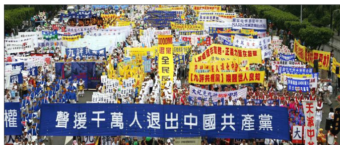
二零零六年四月，台湾民众声援大陆一千万退党潮。