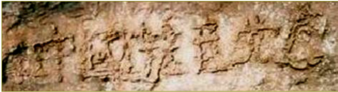
二零零二年六月，在贵州省平塘县掌布乡发现二亿七千万年前的“藏字石”，崩裂的巨石断面上惊现六个大字：中国共产党亡，昭示着“神天中共”的天象。

中共的暴行引起国际正义力量的关注，由全球法、政、医等各界人士组成的“法轮功受迫害真相联合调查团”要求中共开放大陆的监狱、劳教所、看守所和相关的军医院等地，以进行不受限制的调查，终止对法轮功的迫害。◇