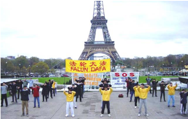
法轮功学员在法国巴黎埃菲尔铁塔下炼功