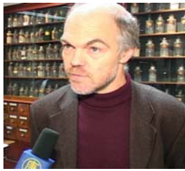
万可润可斯文参议员 就制止中共器官贩卖 接受记者采访

这是一个真实而感人的故事：小真（化名）是一位普通的大陆高中生。一天，他参加学校社团演讲，当他走上讲台，用一颗真心讲出了最真实的感言，这时演讲却被强行打断了。但是他那不平凡的道德勇气，像一道巨大的冲击波经久不息地震撼着