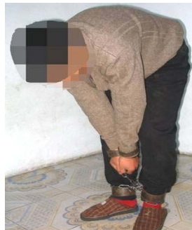
演示图 3：戴 连体手铐脚镣