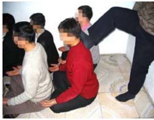
演示图 2：坐板遭脚踹