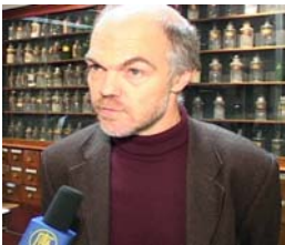
万可润可斯文参议员就制止中共器官贩卖接受记者采访