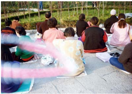
能量场——法轮功学员炼功时拍到的奇妙景象

在我开始炼功的前半年，《转法轮》中讲的开天目、玄关设位、另外空间的许多现象，我在似信非信中都亲身经历过、看见过。《西游记》中讲的很多神话现象，如变大缩小、不怕冷热等，我都亲身体悟过。那种美妙的感受，是无法用语言描述的。