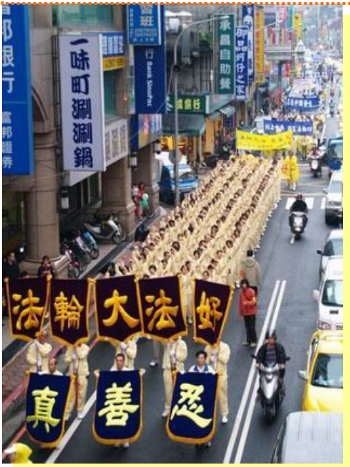
台湾大游行声援三退大潮

双流县的父老乡亲：法轮功学员信仰“真善忍”，修心健身，先他后我、做好人，犯了什么罪？请善良的家乡人伸出援助之手，和我们一起共同制止这场惨无人道的迫害！