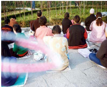
能量场——法轮功学员炼功时拍到的奇妙景象

我们现在说的科学，主要是指西方实证科学。东方的修炼文化，还有宗教的神奇事迹，都不在实证科学的范围内，但人类的科学也是要发展的，现在科学还没触及到的东西，并不一定就不是科学。目前人类的知识很有限，我们不能被僵化了的观念约束了自己。