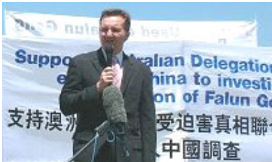
议员克里斯·鲍文说：为什么中国政府不给联合调查团签证。那就是因为活摘器官指控是真实的。

【明慧网】二零零六年十二月七日，澳洲参议员安卓·巴雷特，绿党参议员凯瑞·奈特、工党议员克里斯·鲍文在首都堪培拉国会前，向媒体宣布联合发起成立法轮功受迫害真相联合调查团澳大利亚代表团，要求中共政府开放所有劳教所、医院，让调查团成员进行不受限制的独立调查。