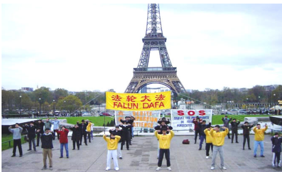
法轮功学员在法国巴黎埃菲尔铁塔下炼功

他们中有学生、商人、公司职员，弘扬了中国正统文化和音乐。欢迎!欢迎你们的到来!” 现场观众超过三十万人，通过 ABC 电视台直播，观看了游行表演约一百五十万人。