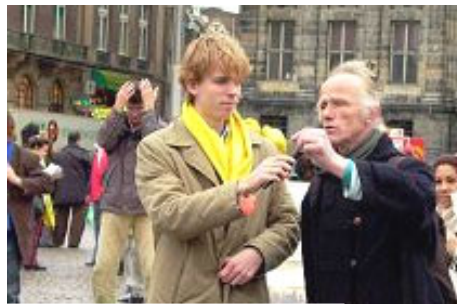
艺术家愤慨的当即作诗 谴责中共暴行

一位艺术家听到迫害真相后，在广场上帮助学员们发了一整天资料。他按不住心中的愤慨，当即作诗：诗