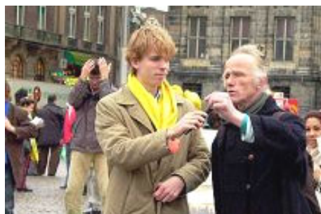
艺术家愤慨的当即作诗 谴责中共暴行

一位艺术家听到迫害真相后，在广场上帮助学员们发了一整天资料。他按不住心中的愤慨，当即作诗：诗