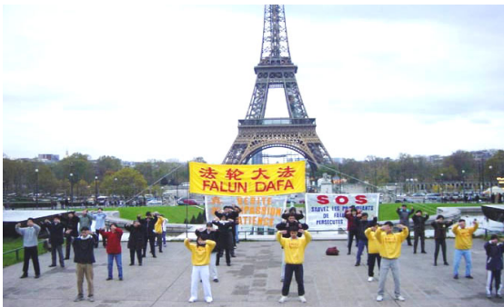
法轮功学员在法国巴黎埃菲尔铁塔下炼功

他们中有学生、商人、公司职员，弘扬了中国正统文化和音乐。欢迎!欢迎你们的到来!” 现场观众超过三十万人，通过 ABC 电视台直播，观看了游行表演约一百五十万人。