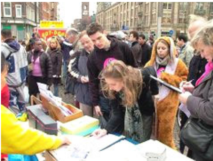
人们等着签字反迫害

人们被迫害的真相所震惊，向学员询问他们可以为法轮功学员做些什么？学员告诉他们：“我们是和平的修炼群体，我们希望每一个人都能了解迫害的真相，站在正义的一边就是对我们的支持。”人们纷纷签名反迫害。