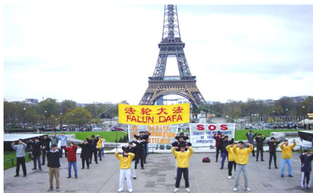
法轮功学员在法国 巴黎埃菲尔铁塔下炼功