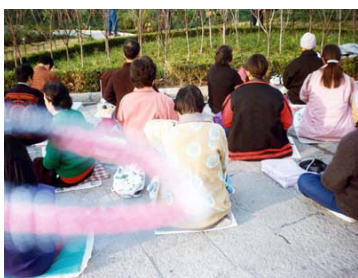
能量场——法轮功学员炼功时拍到的奇妙景象

在我开始炼功的前半年，《转法轮》中讲的开天目、玄关设位、另外空间的许多现象，我在似信非信中都亲身经历过、看见过。《西游记》中讲的很多神话现象，如变大缩