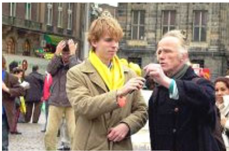
艺术家愤慨的当即作诗 谴责中共暴行

一位艺术家听到迫害真相后，在广场上帮助学员们发了一整天资料。他按不住心中的愤慨，当即作诗：诗“……奥斯威