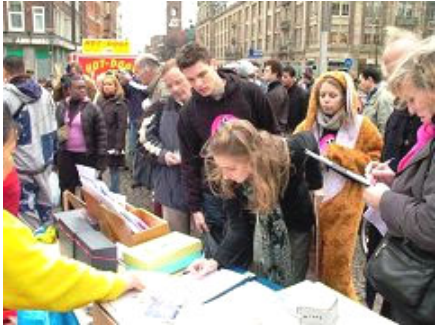
人们等着签字反迫害

【明慧网】二零零六年十一月二十五日，来自荷兰与比利时的法轮功学员来到阿姆斯特丹市中心的水坝广场举行模拟演示，揭露中共活体摘取法轮功学员器官。现场还设有反酷刑展和图片展。