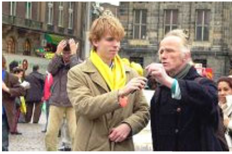
艺术家愤慨的当即作诗 谴责中共暴行

一位艺术家听到迫害真相后，在广场上帮助学员们发了一整天资料。他按不住心中的愤慨，当即作诗：诗“……奥斯威