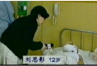
气管切开还能说、唱？记者采访不穿防护服不戴口罩。

◆大面积烧伤病人的创伤面本应尽量暴露，不能用药布包裹烧伤部位，但电视上的“自焚”者却全身包裹严密，丝毫不符合医学常识。