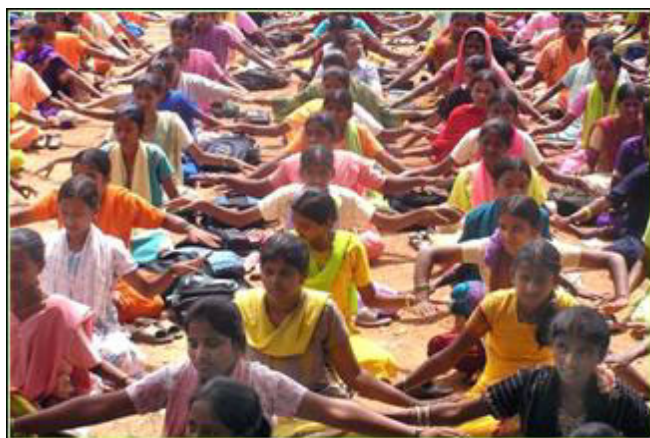
▲印度公立女子学校的校长组织全体一千两百名学生学炼法轮功。

【明慧网】在印度，现在已有至少三十几所学校的成千上万的师生在修炼法轮功。法轮功为