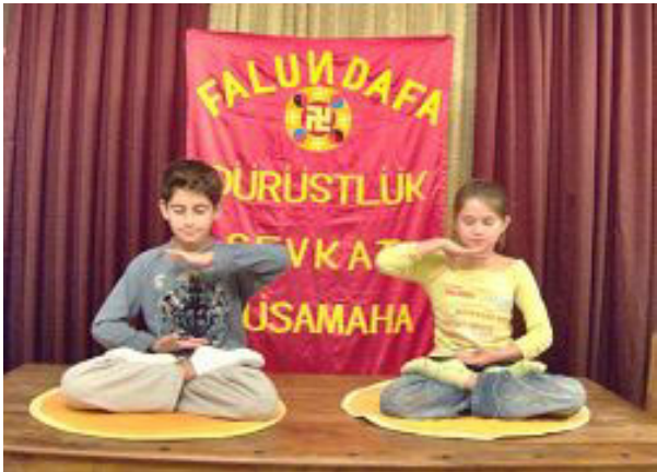
迈克将（左）在炼法轮功第五套功法