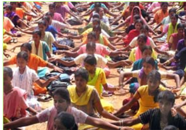
这所印度公立女子学校校长组织全体一千两百名学生炼法轮功。

一所寄宿学校的三百名十年级的学生炼功仅一个学期后，该校即有了神奇的经历：百分之百的学生通过了他们的考试，而通常的合格率只有百分之五十左右。校长因