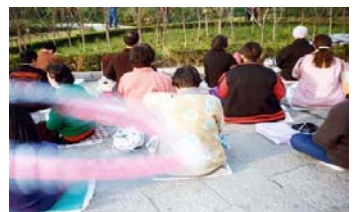
能量场——法轮功学员炼功时拍到的奇妙景象