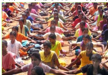
这所印度公立女子学校校长组织全体一千两百名学生炼法轮功。

一所寄宿学校的三百名十年级的学生炼功仅一个学期后，该校即有了神奇的经历：百分之百的学生通过了他们的考试，而通常的合格率只有百分之五十左右。校长因