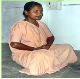
▲这位印度天主教学校的修女教师说：“佛祖来到了世间。”

【明慧网】已经洪传世界八十多个国家的法轮大法，在印度，法轮大法也正在迅速传播，尤其值得一提的是印度学校对大法的认可。