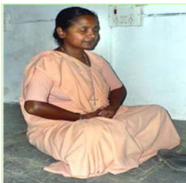
▲这位印度天主教学校的修女教师说：“佛祖来到了世间。”

【明慧网】已经洪传世界八十多个国家的法轮大法，在印度，法轮大法也正在迅速传播，尤其值得一提的是印度学校对大法的认可。