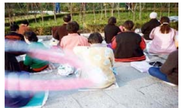
能量场——法轮功学员炼功时拍到的奇妙景象

天后我的膝关节不疼了，还能下蹲了。我明白，那是李老师帮我把体内的寒气驱除出来了。