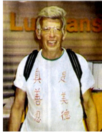
瑞姆 T 恤上的“真善忍是美德”清晰可读

2005 年 9 月，瑞姆先生第二次来到中国。这次他身穿一件写有“真善忍是美德”的 T 恤，在中国旅行了三周，让人们关注中共对法轮功学员的迫害。