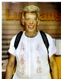
瑞姆 T 恤上的“真善忍是美德”清晰可读

2005 年 9 月，瑞姆先生第二次来到中国。这次他身穿一件写有“真善忍是美德”的 T 恤，在中国旅行了三周，让人们关注中共对法轮功学员的迫害。