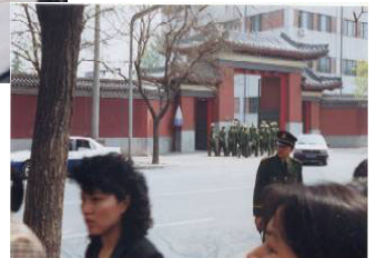
右图：和上访群众隔街相望的是中南海西门（这里可以看到紫禁城的红色围墙）

从这些图片中我们很难看出“围攻”，而且上访的地点也不是中南海，而是相邻中南海的“西安门大街”，是当时国务院信访局的所在地。中国设立信访制度的本意，是为了使群众疾苦有一个下情上达的渠道。上万名群众直接来到国家最高的信访部门，这在中国历史上还是第一次。