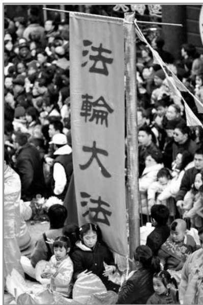
法轮功队伍在游行中

今天，丹麦多个城市都有炼功点，在哥本哈根、奥尔胡斯（Aarhus）、奥登塞（Odense）……在国王公园里、女王皇宫前、美人鱼雕像的海边、市政厅广场、新广场川流不息的人流中，都可以听到法轮功优美的炼功音乐，可以看到法轮功学员讲法轮功的真实故事。而他们每个人也都有自己动人的故事。