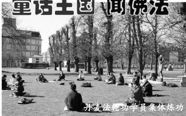
丹麦法轮功学员集体炼功