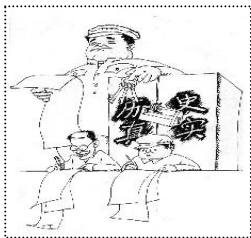
伪造历史、掩盖真实、进行洗脑是中共的一贯伎俩。

这一场大饥荒被中共歪曲成“三年自然灾害”，实际上那三年风调雨顺，大规模严重的洪水、干旱、飓风、海啸、地震、霜、冻、雹、蝗灾等自然灾害一次也没有发生，完全是一场彻底的“人祸”。由于“大跃进”使全民炼钢，大量庄稼抛洒在地里无人收割，直到烂掉为止；同时各地却“争放卫星”，柳州地委第一书记贺亦然甚至一手导演炮制了环江县水稻“亩产十三万斤”的特号新闻。正好庐山会议后，中共在全国“反右倾”，为体现其一贯正确，在全国按照虚报的产量进行粮食征购，结果把农民的口粮、种子粮、饲料全部收走，仍然搜刮不够征购数量就诬蔑农民把粮食藏