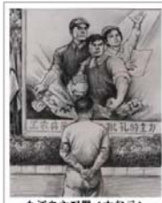
九评之六配图《大纪元》

虽然中华民族在历史上多次遭到侵略和打击,其传统文化一直表现出极大的融合力与生命力,其精华代代相传。“天人合一”代表着我们祖先的宇宙观;“善恶有报”是社会的常识;“己所不欲,勿施于人”,