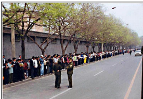
法轮功学员没有阻塞交通，警察没事闲聊天