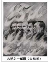
九评之一配图

1840年,被史界认为是中国近代史的开端,也是中国从中古世纪走向现代化的起点。从那时候起,中华文明大概经历了四波的挑战和回应。前三波挑战,可以以1860年英法联军攻入北京,1894年中日甲午战争和1906年日俄在中国东北的战争为冲击肇因所形成的挑战,而中国对之的相应回应,则是器物引进(即洋务运动),制度改良(即戊戌变法和