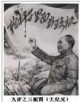
九评之三配图《大纪元》

建国仅3个月，共产党就着手在全国全面开展土地改革。用“耕者有其田”的口号，鼓动无田的农民斗争有田的农民，鼓励、放纵人性中自私自利、为所欲为、不讲道德的一面。同时，在土地改革总路线中明确提出“消灭地主阶级”；在农村广泛划分阶级、定设成份、给全国不下二千万人带上“地、富、反、坏”的帽子，使他们成为在中国社会备受歧视、打击、没有公民权利的“贱民”。与此同时，随着土地改革深入到边远地区和少数民族，共产党的党组织也迅速扩大，发展到乡有党委、