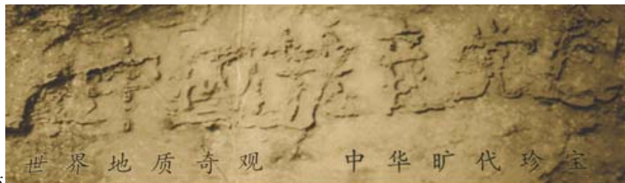
贵州省平塘县掌布乡“藏字石”风景区门票图案

珍惜生命的可贵，愿竭尽所能将天灭中共与人类大淘汰的信息传达给您。天象已渐明，智慧的您应该如何判断呢？此事绝非关政治，是救人命。若观念上仍有人视此保命信息为介入政治，其人可能已被共党邪灵控制或影响而不自知，一如南亚大海啸发生前，无人愿理会土著呼喊撤离的警告一般，生命肯定是有危险的。先哲慈悲，将预言留传于世，机会稍纵即逝，既已看罢《九评共产党》，明了共产党的邪恶真面目，不要再与邪魔共舞，在天灭中共前夕，清醒的选择正义与良善，才能让您的生命远离大淘汰的威胁，迎向更美好的未来。