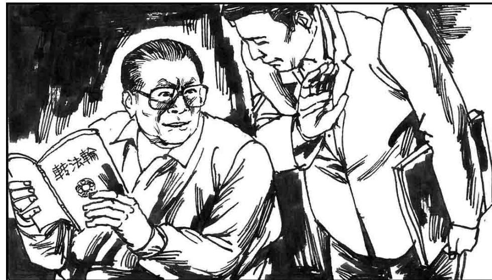
14. 江泽民开始也不反对法轮功，还看过《转法轮》。但江最感兴趣是想托人向李大师打听自己的前世、预测自己的政治前途和怎么保住权位等。李先生看透了他的心思，表示治病可以，不问政治。江从此怀恨在心。