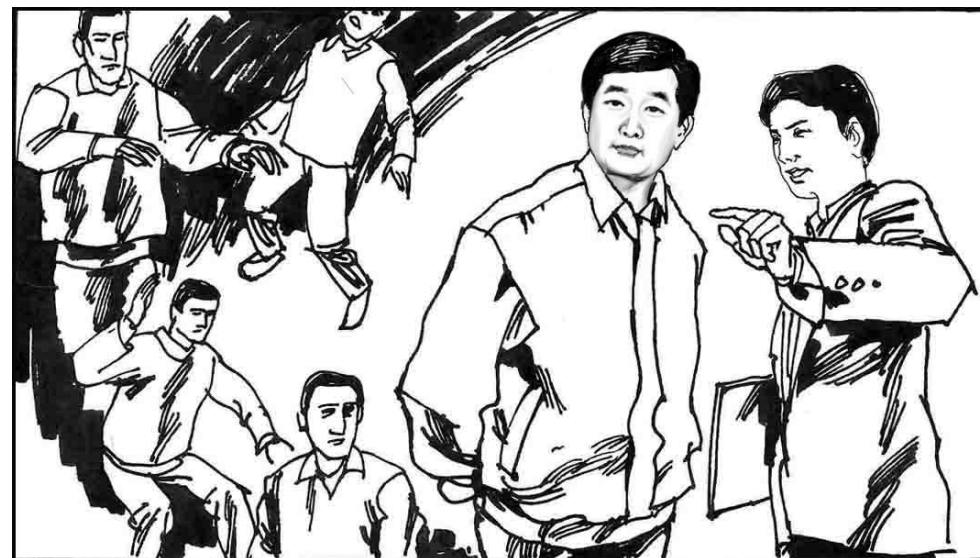
6. 李洪志先生 1992 年传功讲法的时候，中国气功师多如牛毛，真伪俱在，鱼龙混杂。虽有许多人从太极拳、五禽戏等传统功法中获得了身体的健康，但上了假气功师的当、花了冤枉钱却治不好病的也不在少数。