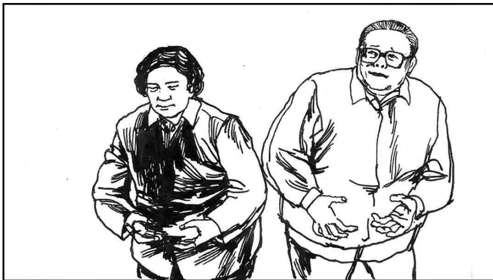
13. 江泽民在 1999 年镇压法轮功时声称从来没有听说过法轮功。其实王冶坪 1994 年就跟人学过法轮功。王练功时江也在旁边偷偷比划，一次被王发现，江恼羞成怒，不许她再练。他说：“连我老婆都信李洪志了，谁还来信我这总书记！”