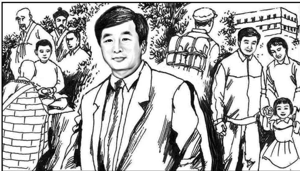
1. 法轮功创始人李洪志先生 1951 年 5 月 13 日生于吉林省公主岭的一个普通知识份子家庭，从童年起修炼佛家独传大法。参过军，后转业到长春市的一家粮油公司。他是一个普通职员，一家人住在单位简陋的宿舍楼里。