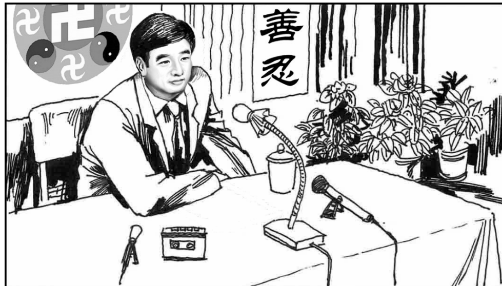
2. 1984 年，李先生将独修功法改编成适合大众普及的法轮功，于 1992 年 5 月 13 日开始在长春公开传功讲法。1992 年到 1994 年这两年多的时间里，李先生在全国共开设了 54 次讲法传功的学习班。