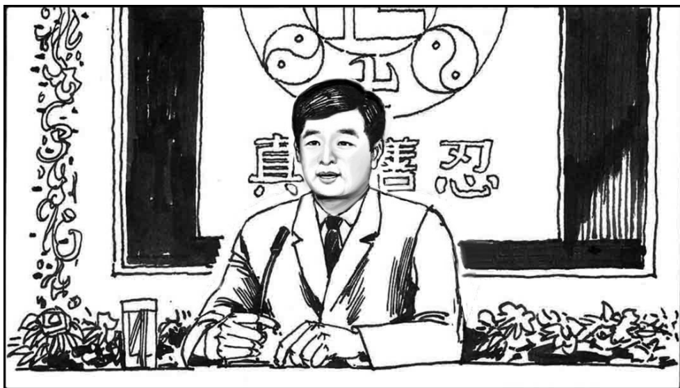
11. 95 年李洪志先生结束了在国内传功讲法，年初赴巴黎传法，与中国驻法国大使等使馆官员进行了会面，并应邀在中国驻法国使馆文化处举行了一场讲法报告会。随后又去了瑞典和美国，法轮功开始弘传世界各地。