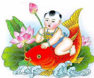
北京清华大学大法弟子致贺于 2006 年春節