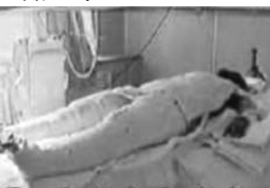
▲央视《焦点访谈》中的“自焚者”被包裹得严密。