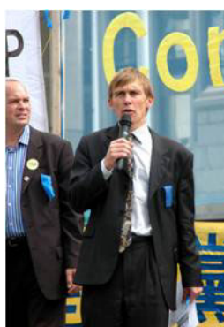
▲新西兰惠灵顿市政府官员谴责中共对法轮功的迫害