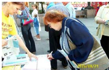
俄罗斯老人签名支持反迫

俄罗斯的第一个炼功点是在1996年8月，由清华大学一位老学员在圣彼得堡建立的。1997年11月又从中国来了一行十七名学员，有大学的教授，也有从事俄文翻译的专家，他们带着李洪志老师的九讲班录像带，风尘仆仆，自费从满洲里坐火车历经一个星期，到达圣彼得堡，开办第一个九讲录像班。参加录像班的除圣彼得堡的当地人，还有各地在那里出差的、探亲的、旅游的有缘人。这一批老学员又把大法的福音带到了各地，从此在许多城市有了炼功点。