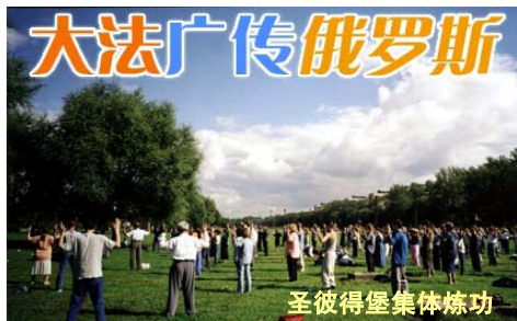
圣彼得堡集体炼功

俄罗斯是世界上地域最辽阔的国家。同在世界其它七十多个国家一样，法轮大法以“真善忍”的理念和祛病健身的奇效在这片广袤的土地上洪传。从1996年第一个炼功点在圣彼得堡成立以来，至今已有二十多个城市和地区有辅导站和炼功点。