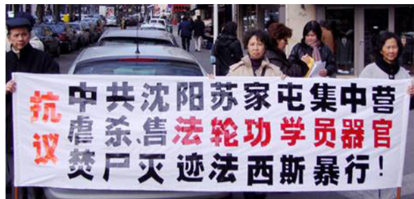
法国学员中使馆前呼吁停止迫害

■全球抗议苏家屯秘密集中营暴行：惊闻“苏家屯秘密集中营”活体摘取、出售法轮功学员器官、并焚尸灭迹的暴行，全球法轮功学员及正义人士纷纷以各种不同的形式揭露中共的罪恶，呼吁国际社会展开调查，共同制止残忍的虐杀和迫害。