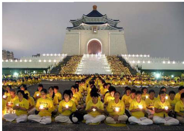
▲台湾五千法轮功学员 2004 年 7 月 17 日烛光守夜，悼念在大陆被迫害致死的同修。