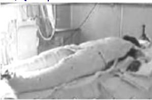
▲央视《焦点访谈》“自焚者”被包裹得密。