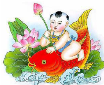
北京清華大學大法弟子敬賀于 2006 年春節