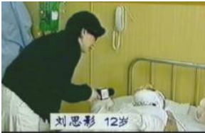
气管切开还能说、唱？ 记者采访不穿防护服，不戴口罩