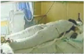
央视《焦点访谈》中的“自焚者”被包裹得严密。

表公告，指出：“天灭中共是历史的必然，神必将清算对大法行恶者。在这种情况下，如果有人不悬崖勒马，继续执行江氏流氓集团的镇压政策，就是罪不容恕，定将受到严惩。……” 公告同时指出：“大法的传出就是为了救度世人，包括社会各阶层的人士。即使曾经做过错事的人，也还有机会弃恶从善。……”