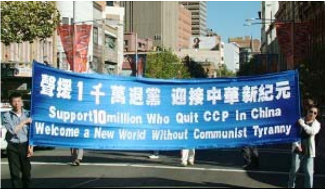
澳洲集会游行声援千万退党 呼吁制止中共虐杀

《九评共产党》，一本解体中共的“奇书”、一本“改变世界的书”。自从该书2004年11月出版以后，已在中国促成一项史无前例的强大的退出中共恶党的精神觉醒运动，到2006年4月10日已超过 963 万人退出共产恶党及其相关组织。 法轮功学员传播“九评”不是为了打倒中共和争夺权力，而是为了帮助人们认清中共的邪恶本质，不再有意无意地随从其继续迫害法轮功，使发生了六年多的迫害早日停止。