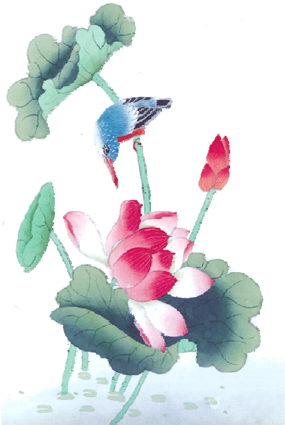
第 3 期