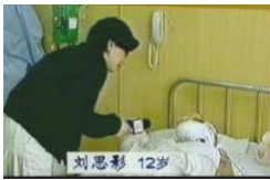
气管切开还能说、唱？ 记者采访不穿防护服，