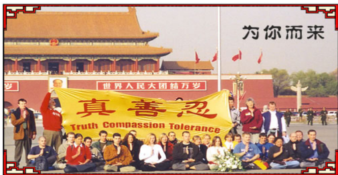
从 2001 年 11 月到 2002 年 11 月之间，先后有 100

几年来，莎拉与父亲一直热忱投入世界各地法轮功学员反迫害活动，告诉世人法轮大法的美好和中共迫害法轮功的真相，莎拉多次在活动中演唱《得度》这首歌，感动了许多东西方民众，让他们明白了真相。