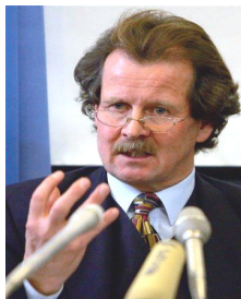
联合国酷刑问题 特派专员曼夫德- 诺瓦可先生