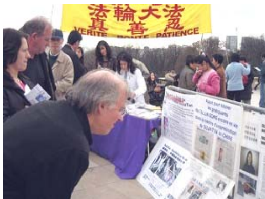
德国民众在了解发生在苏家屯的罪行▲