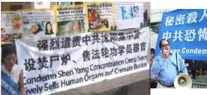
澳洲法轮功学员 呼吁紧急救援， 制止灭绝屠杀▼

中共在苏家屯建立秘密集中营迫害法轮功学员的残酷事实一经曝光，立刻引起各方关注。世界各地的法轮功学员们及一些正义人士纷纷举行集会游行，强烈谴责中共苏家屯集中营对法轮功学员实施惨无人道的剖取器官、焚尸灭迹的罪行，并强烈呼吁联合国立即对中共的这一暴行进行调查。制止虐杀和紧急营救在中国遭受迫害的法轮功学员。