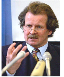
联合国酷刑问题特派专员曼夫德-诺瓦可先生

【明慧网 2006 年 3 月 31 日】据路透社 3 月 30 日日内瓦消息，联合国酷刑问题调查员诺瓦克(Manfred Nowak)星期四表示，他正注意法轮功组织的指控，即数千法轮功学员被关押在中共的“集中营”内，其中一些被杀害这项控告指出，法轮功学员的器官被出售，目前尚未有人能够离开这座集中营。”诺瓦克在新闻发布上说：“目前，我正在尽全力调查这些控告，如果我的调查发现这是严重的、证据确凿的控告，我将正式向中共政权提交这一控告。”