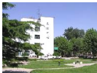
山东省警官总医院

警官医院分为内外两个院，外院对社会开放。两道铁门后为内院。内院的规章制度按照监狱执行，所以内院其本质是又一所监狱，只是多了些医生和医疗设备而已。