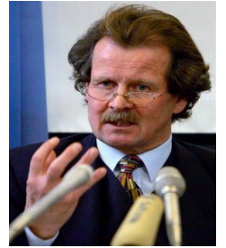
联合国酷刑问题调查员曼夫德-诺瓦可先生

《九评共产党》，一本解体中共的“奇书”、一本“改变世界的书”。自从该书 2004 年 11 月出版以后，已在中国促成一项史无前例的强大的退出中共恶党的精神觉醒运动，到 2006 年 4 月 19 日已有 984 万人退出共产恶党及其相关组织。