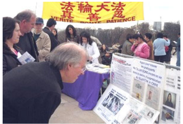
▲ 德国民众在了解发生在中国劳教所、监狱、集中营的对法轮功学员实施惨无人道的迫害，剖取器官、焚尸灭迹等罪行。

于是我驱车几百里路途，到老家去见堂叔。刚刚停好车，堂叔却从屋里走出来，说了声：来了。我们似乎都知道彼此的心事一样，默默地走进了屋，堂叔看着一瓢清水，眉头紧锁无语……我问：“为什么会是这样？”堂叔头也没抬，说：“这些说法是真的，但是这只是一部分，这是一件震动天庭的事。那些害人的人不久就会非常惨的死去，非常的惨。那些杀人的人是什么都不信的人，到时他会知道什么叫恐惧。这件事情涉及的人太多，几乎是每个人，天神在看着每个人的一举一动，包括他们的