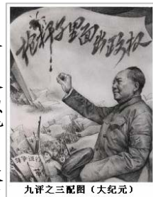
九评之三配图

让我们来回忆一下中国在共产党统治之下步履艰难走过的五十五年,看一看中国共产党在夺取政权之后是怎样利用政府机制,以阶级斗争为纲领来实行阶级灭绝,以暴力革命作工具来实行恐怖统治的。它“杀人”与“诛心”并用,镇压共产党之外的一切信仰;粉墨登场,为共产党在中国的“造神”运动拉开了大幕。根据共产党的阶级斗争理论和暴