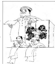
伪造历史、掩盖真实、进行洗脑是中共的一贯伎俩。