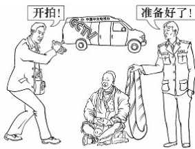
自焚骗局