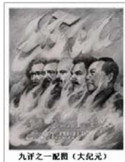
九評之一 配圖

命的第二年,苏俄共产党(布)正式诞生。这个共产党是在对“阶级敌人”实行暴力中产生的,之后则在对自己人的暴力中维持存在。苏联共产党在内部整肃中,屠杀了两千多万“间谍”“叛徒”和异己分子。