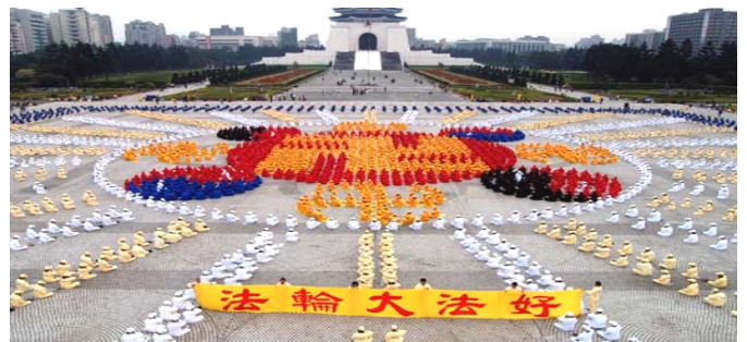
2005 年 12 月 4000 多名台湾法轮功学员 在台北广场排法轮图形

真善忍的伟大力量将被永世传颂，在佛法真理的感召下，必会有更多的生命在精神的回归过程中升华，就让我们共同见证这伟大的历史瞬间吧！