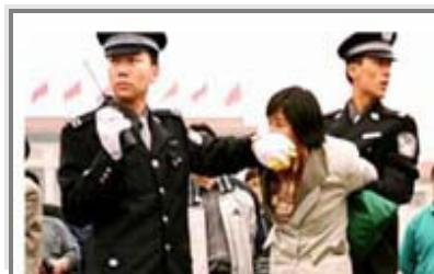
人们说真话的权利被剥夺了

对真善忍的诋毁，就等于告诉人不能做个好人，对信奉真善忍的修炼人大打出手，就等于在宣称做好人有罪。面对铁窗和酷刑，是隐忍偷安，还是揭竿而起？