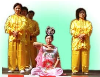
▲ 在舞台上演示功法

2006年5月4日，在日本福冈文化节的盛大游行活动中，法轮功学员的中华舞龙舞狮队、炼功队和古装仙女队的精彩表演，赢得观众的阵阵掌声，许多观众