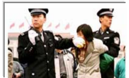
人们说真话的权利被剥夺了

对真善忍的诋毁，就等于告诉人不能做个好人，对信奉真善忍的修炼人大打出手，就等于在宣称做好人有罪。面对铁窗和酷刑，是隐忍偷安，还是揭竿而起？