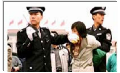
人们说真话的权利被剥夺了

对真善忍的诋毁，就等于告诉人不能做个好人，对信奉真善忍的修炼人大打出手，就等于在宣称做好人有罪。面对铁窗和酷刑，是隐忍偷安，还是揭竿而起？