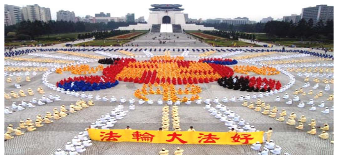
2005 年 12 月 4000 多名台湾法轮功学员 在台北广场排法轮图形

真善忍的伟大力量将被永世传颂，在佛法真理的感召下，必会有更多的生命在精神的回归过程中升华，就让我们共同见证这伟大的历史瞬间吧！