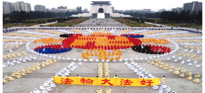
2005 年 12 月 4000 多名台湾法轮功学员 在台北广场排法轮图形

真善忍的伟大力量将被永世传颂，在佛法真理的感召下，必会有更多的生命在精神的回归过程中升华，就让我们共同见证这伟大的历史瞬间吧！