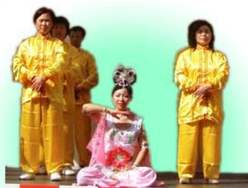
▲ 在舞台上演示功法

2006 年 5 月 4 日，在日本福冈文化节的盛大游行活动中，法轮功学员的中华舞龙舞狮队、炼功队和古装仙女队的精彩表演，赢得观众的阵阵掌声，许多观众